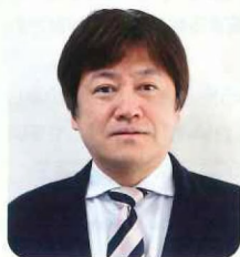
医療法人みやうち 理事長