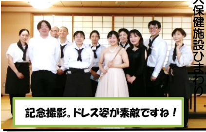
記念撮影。ドレス姿が素敵ですね！

「デイサービスセンターひまわり」にて開催されました。今回はフルートとピアノによる「カウボーリデュオ」(ハワイ語で「あなたと一緒に」)が登場しました。同デュオは平成29年に開催された「n-cafe ひまわり」第1回に出演していただいた以後、ありがとうございました。何れも出演してくださっています。お二人は親子で、ともにヤマハ音楽教室の講師として活躍され、エリザベト音楽大学の出身だそうです。息の合った演奏とやわらかな音色で、会場は穏やかな空気に包まれました。童謡から朝ドラの主題歌まで幅広いジャンルの楽曲を全8曲披露。曲ごとに雰囲気が変わり、来場者は時に口ずさみ、時に耳を傾けながら、それぞれの音楽の世界を楽しんでいる様子でした。アンコールでは「涙そうそう」が演奏され、しっとりとした余韻が会場に広がりました。華やかなドレスも印象的で会場を華やかに彩りました。第2部のミニ講座では、地域包括支援センター中部より配食サービスについての説明が行われ、日常生活を支える地域の取り組みについて理解を深める機会となりました。続いて介護老人保健施設ひまわりの理学療法士による体操が行われ、参加者は体を動かしながら、無理なく続けられる運動を体験しました。会場には笑顔が見られ、和やかな雰囲気の中での実践となりました。当日は33名が参加し、会場は満席となる盛況ぶり。音楽と学びが一体となり、参加された皆様は心豊かな時間を過ごされていました。