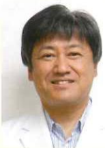
医療法人みやうち 理事長