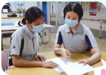
意欲的に学んでさっそく戦力に!

で日本や介護のことを学ぼうという意欲が高く、やる気に満ちた2人でした。少しずつ仕事も覚えていき、入職後3カ月経った今では一戦力としてしっかり働いています。