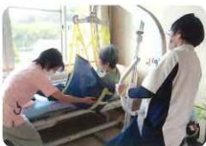
(リハビリテーション室 室長)

として、精進していきたいと思えます。 現在20拠点の「いきいき体操」を支援しています。これからも必要とされる介護老人保健施設の職員として、精進していきたいと思えます。 当施設のリハビリテーション室は理学療法士7名、作業療法士4名、言語聴覚士1名が在籍しおのおのが専門性を活かしつつ、利用者様に寄り添った関わりを心掛けています。また他の職種とも協力し、在宅復帰に向けた取り組みとして自宅訪問や積極的な福祉用具の提案を行っています。最近では「急な坂道を上り下りできないため自宅から外出できない」という方に対して電動アシスト付き歩行車を提案し、実際に自宅前の上り坂を試しました。また職場での腰痛軽減を目指し、移乗介助時にトランスファーボードやリフト導入を進めています。グループホーム三滝ひまわりに関わることで、日常生活の中にリハビリテーションを取り入れるように支援しています。地域活動では、中広圏域を中心に現在20拠点の「いきいき体操」を支援しています。これからも必要とされる介護老人保健施設の職員として、精進していきたいと思えます。