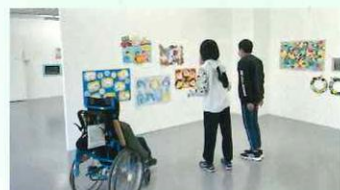
▲2023年の展示風景より

期間 2024年2月17日(土)~3月3日(日) 10:00~17:00 休館日 火・水 観覧料 無料