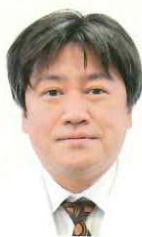
医療法人みやうち 理事長