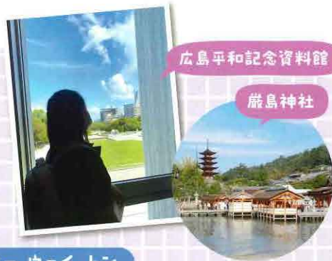
広島平和記念資料館