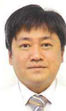
医療法人みやうち 理事長