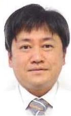
医療法人みやうち 理事長