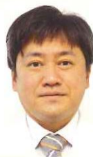
医療法人みやうち 理事長