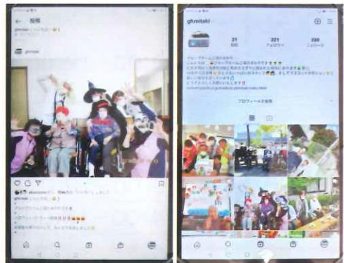
(グループホーム三滝ひまわり ホーム長)