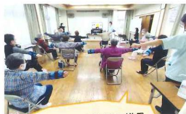
いきいき百歳体操の様子