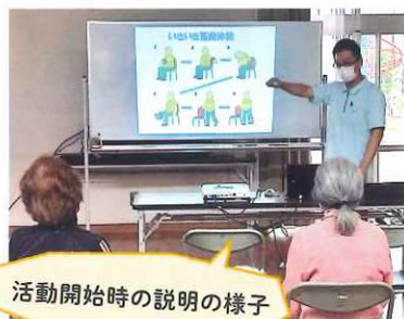
活動開始時の説明の様子