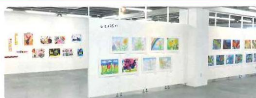
2021年の展示風景より