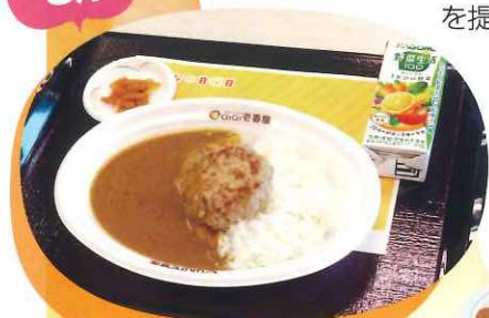
ココイチ特製カレー