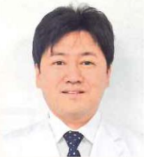
医療法人みやうち 理事長