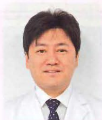
医療法人みやうち 理事長