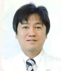
医療法人みやうち 理事長