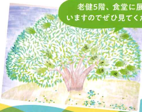
老健5階、食堂に展示していますのでぜひ見てくださいね♪