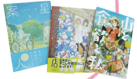
山と食欲と私 / ©信濃川日出雄 (新潮社) 金魚屋古書店 / ©芳崎せいむ (小学館) 星の案内人 / ©上村五十鈴 (芳文社)

私の話も今回で終了となりました。物語は人間の考え出した一番罪のない娯楽であり、よい人生の指針となることもあります。どうか皆さんが素晴らしい一冊に出会えますように!! (のぶちゃん)