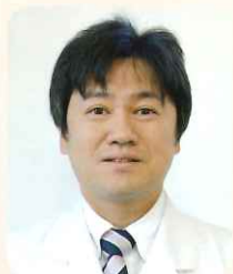
医療法人みやうち 理事長