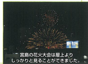
宮島の花火大会は屋上より しっかりと見る事ができました。