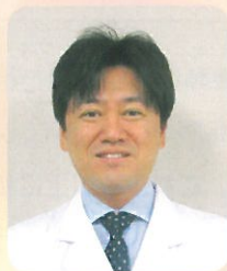
医療法人みやうち 理事長