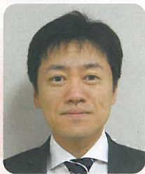
医療法人みやうち 理事長