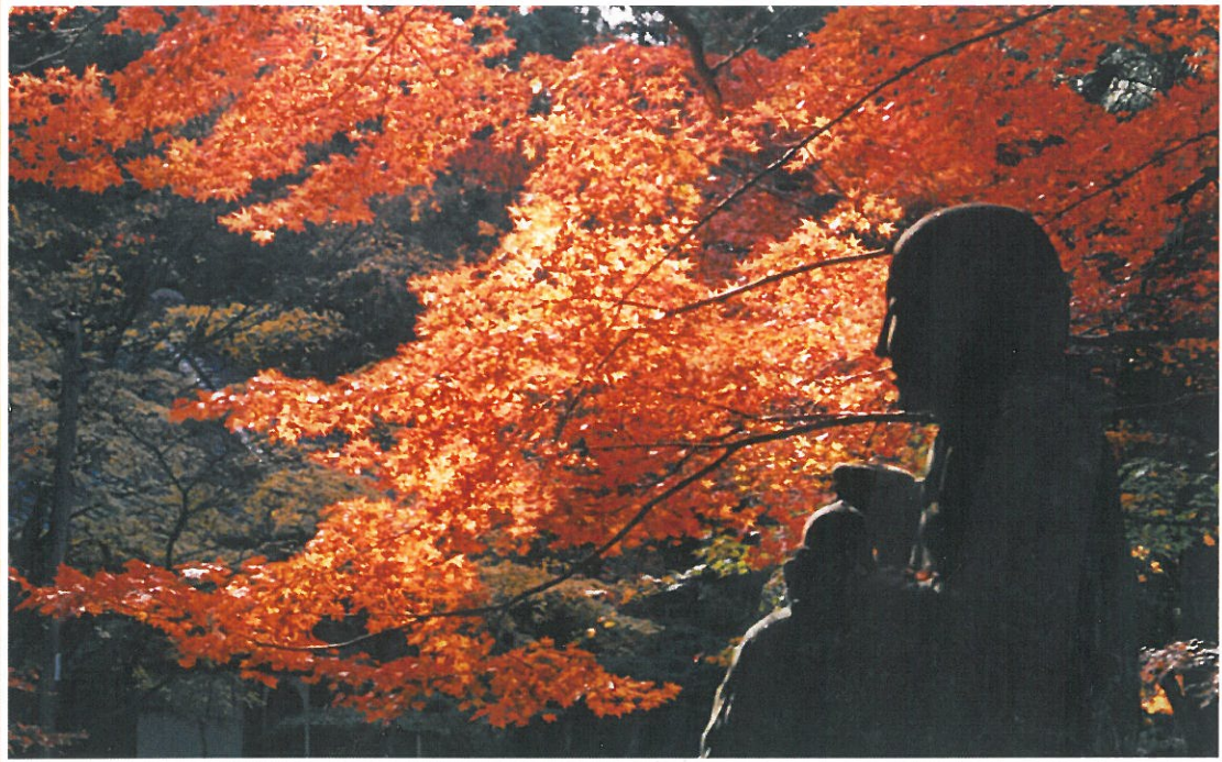
佛通寺（広島県三原市）にて撮影：職員提供