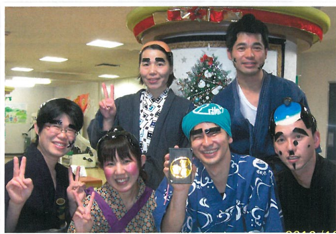
▲写真はデイケア年忘れ会の劇「水戸黄門」より

各家庭の生活環境や介護の状況をふまえた関わりを行っています。年間の行事（夏祭りや年忘れ会など）にはスタッフも一緒になって参加し、ご利用者の方に楽しんでいただいています。私たちが関わることで皆様の笑顔が見られ、生活への意欲が湧いてくるようにお手伝いをさせていただきます。