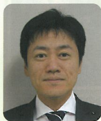
医療法人みやうち 理事長