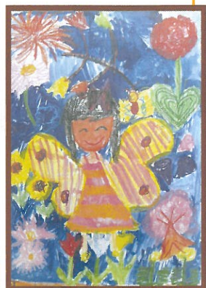
2年生「ちょうちょになったわたし」

院内に展示させていただいている子どもたちに思いをはせ、健やかな「心の成長」をととももお祈りしたいものです。