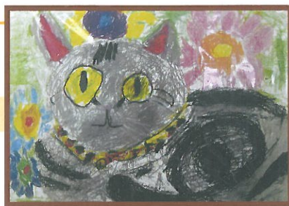
1年生「ほくんちのねこ」