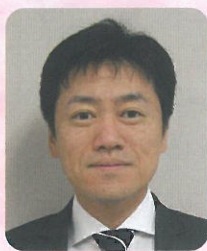
医療法人みやうち 理事長