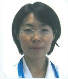
廿日市野村病院 内科 医師