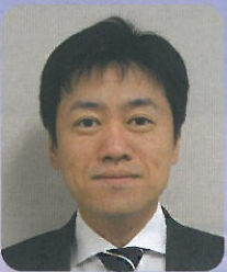
医療法人みやうち 理事長