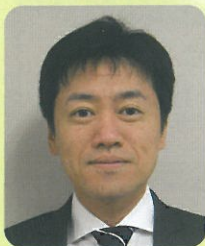
医療法人みやうち 理事長