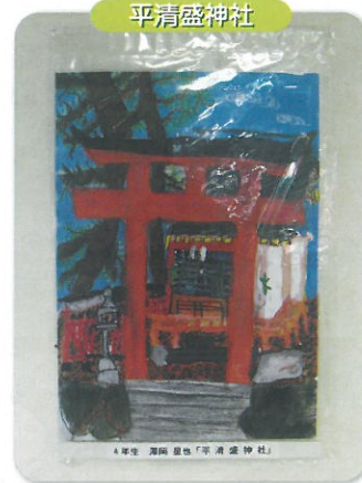
4年生 海原 豊也「平清盛神社」