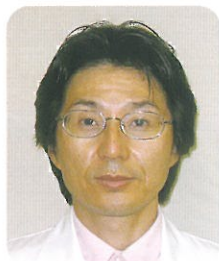
廿日市野村病院 院長