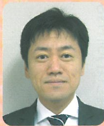
医療法人みやうち 理事長