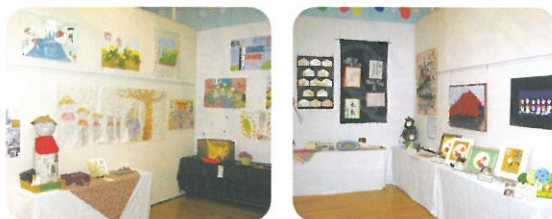
前回の 作品展の 様子

今年も、以下のとおり「医療法人みやうち作品展」を開催することになりました。皆様のご来場を心よりお待ちしております。