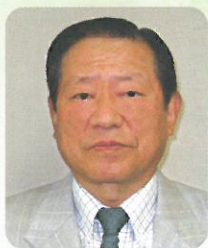
医療法人みやうち 理事長