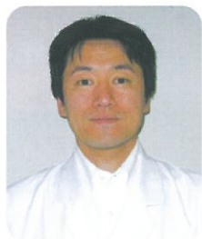
廿日市野村病院 副院長