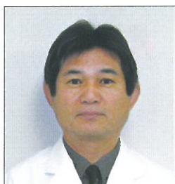
介護老人保健施設ひまわり 施設長