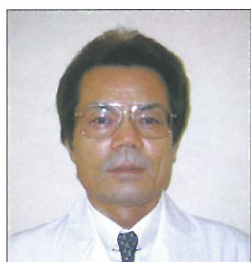
介護老人保健施設三滝ひまわり 施設長