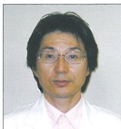
廿日市野村病院 院長