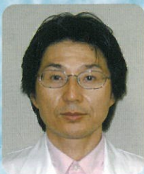
医療法人みやうち 廿日市野村病院 院長