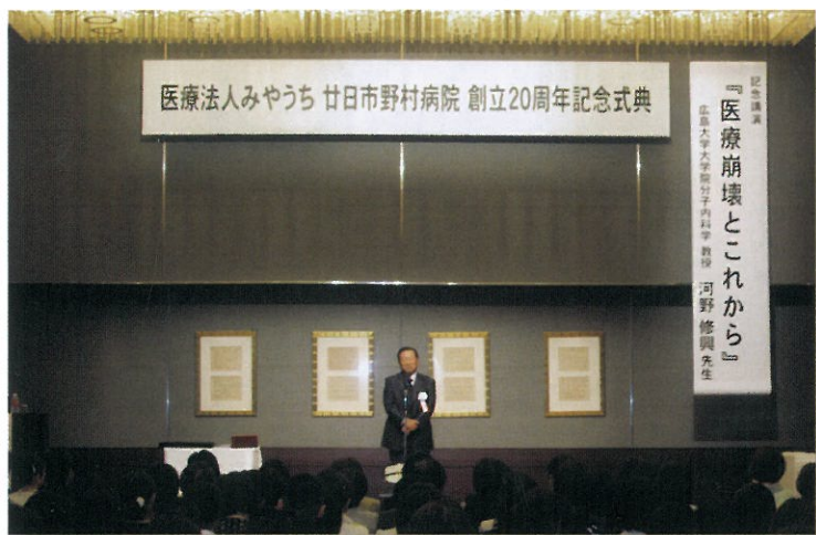
創立20周年記念式典の様子

恒例となっています病院での健康フェアでは、佐伯中央農協さんのご協力朝市を催したり、三滝老健ひまわりでは盆踊り大会に大勢のご家族や地域の方々のご参加をいただいておりますが、これからも当医療法人が地域の方々にどういう形でお返しできるか、皆様方からのお知恵を拝借できれば有難いと願っています。