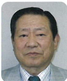
医療法人みやうち 理事長