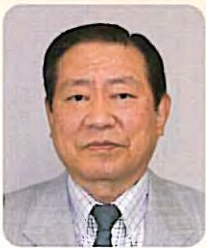
医療法人みやうち 理事長