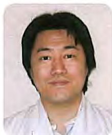
甘日市野村病院 副院長